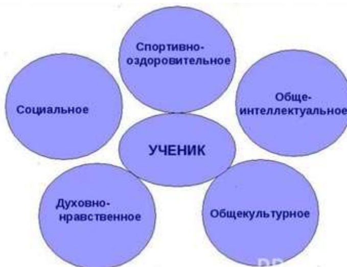
Рис. 2. Направления развития ребёнка.

секции, учащиеся прекрасно адаптируются в среде сверстников, благодаря индивидуальной работе руководителя, глубже изучается материал. На занятиях руководители стараются раскрыть у учащихся такие способности, как организаторские, творческие, музыкальные, что играет немаловажную роль в духовном развитии младших школьников (см. рис. 2).